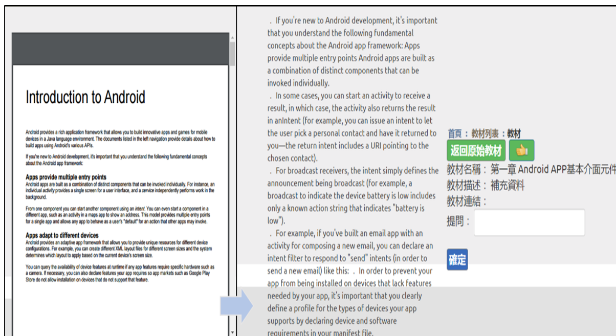
圖 5 摘要教材呈現方式 (PDF 版本)