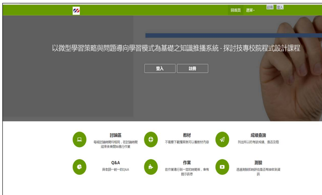
圖 3 系統主要介面圖

系統實作的描述如下列圖示，本研究的系統主要架設在 Microsoft Server 2008 上，並以 Microsoft Internet Information Services (IIS) 7.0 為網頁伺服器軟體，程式編輯環境為 Visual Studio .Net 2013，以 C# 程式語言為主要程式，資料庫為 MySQL 資料庫，圖 3 為系統的主要介面，本系統為一完整之數位學習系統，因此功能包含了使用者角色分類、教材管理、作業管理以及討論區管理等等功能，而圖 4 與圖 5 則是呈現本研究主要的摘要教材功能，學習者可以在教材區看到教師所上傳的教材，包含投影片與 PDF 的格式，針對這兩種格式，本系統在教師上傳教材之後便開始進行自動化摘要的計算，並產生相對應的摘要教材，學習者只要在點選教材後，再選擇摘要教材的按鈕，即可瀏覽系統自動產生的摘要教材。