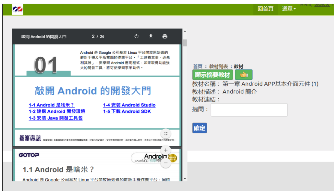
圖 4 教材呈現方式 (投影片版本)